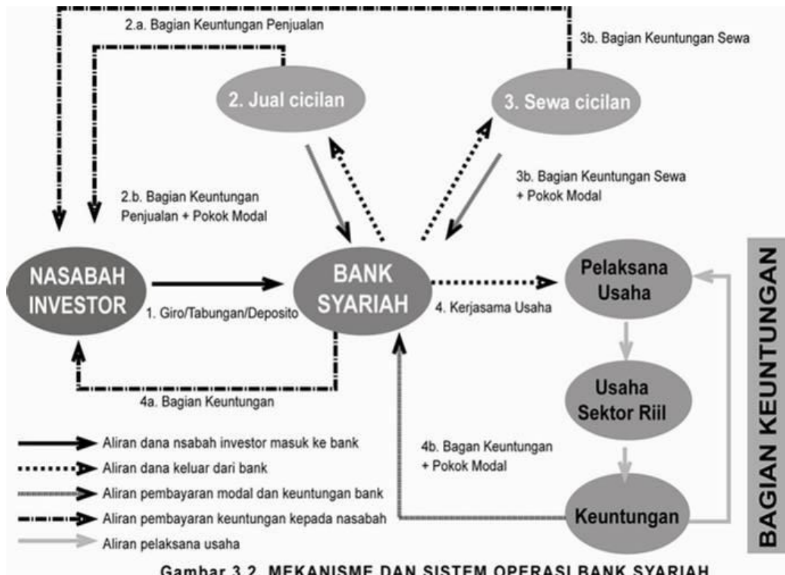
Gambar 3.2. MEKANISME DAN SISTEM OPERASI BANK SYARIAH